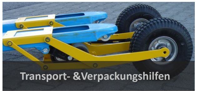
Transport- & Verpackungshilfen